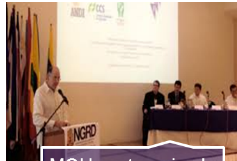
MOU sector privado - UNGRD- OFDA