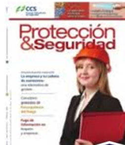
Divulgación de información técnica