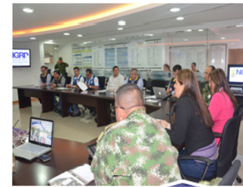
Comité Nacional de Reducción