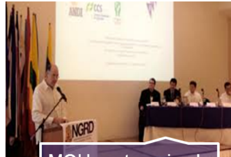
MOU sector privado - UNGRD- OFDA