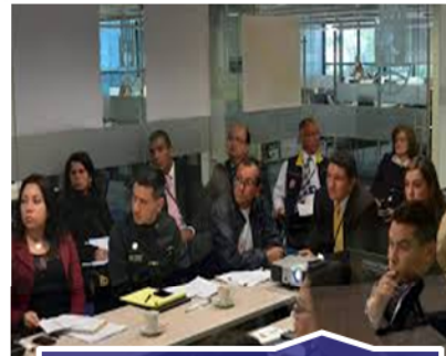
Comision de riesgos tecnológicos - CNARIT