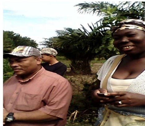
Autoridades Vice Alcaldesa y Regidor