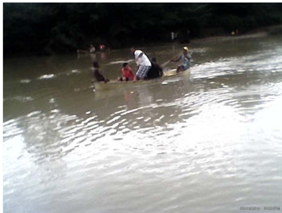
Trabajo mancomunado traslado

TALLER EN RIO ESTEBAN, JUTIAPA, COLON El 10 de enero 2014 , el río inundó la comunidad.