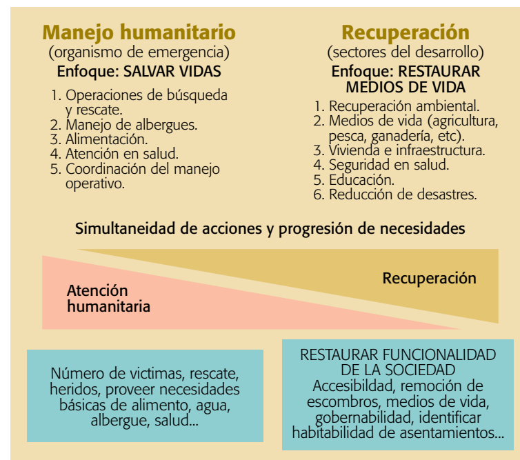
GRÁFICO 19 TRANSICIÓN ENTRE MANEJO HUMANITARIO Y RECUPERACIÓN

El marco general del enfoque de recuperación, como lo define el Programa de las Naciones Unidas para el Desarrollo (PNUD), es el de restaurar la capacidad de las instituciones nacionales y las comunidades para recuperarse de un conflicto o de un desastre de origen natural, e incorporarse en un proceso de transición que aborde los riesgos que ocasionan desastres y promueva la reducción de los mismos. Implica, por tanto, “volver a construir mejor” y evitar reincidencias; es decir, TRANSFORMAR MIENTRAS SE REPARA.