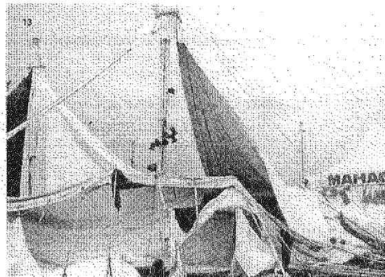
13 Los temporales Lothar y Martin -que aparecieron en Europa central poco después de las Navidades- también destruyeron carpas y otras instalaciones que se habían levantado para celebrar las fiestas del cambio de milenio. En la imagen se puede ver una carpa derrumbada en Múnich.