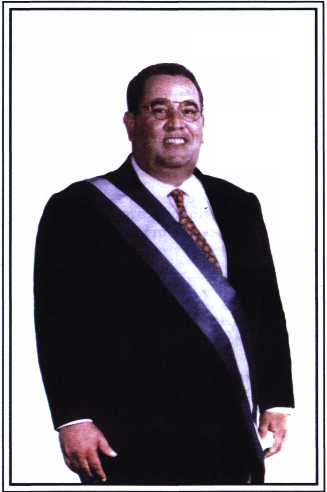
Excelentísimo Señor Presidente de la República de Nicaragua Dr. Arnoldo Alemán Lacayo