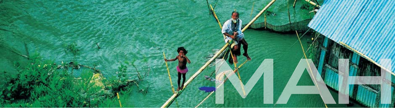
Fotografía de Yann Arthus-Bretrand: viviendas inundadas, sur de Dhaka, Bangladesh