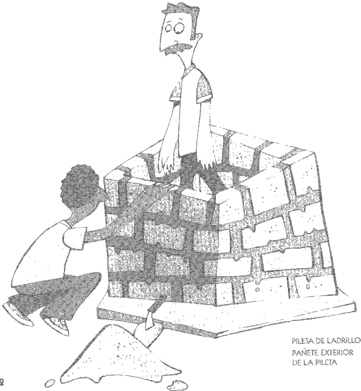
PILETA DE LADRILLO PAÑETE EXTERIOR DE LA PILETA