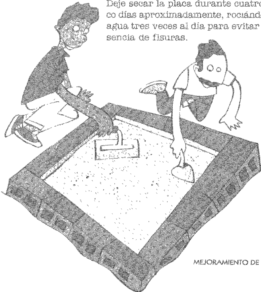
MEJORAMIENTO DE LA SUPERFICIE

Deje secar la placa durante cuatro o cinco días aproximadamente, rociándola con agua tres veces al día para evitar la presencia de fisuras.