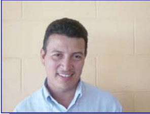
NOMBRE: Carlos Cortéz INSTITUCION: Alcaldía Municipal CARGO: Alcalde Municipal