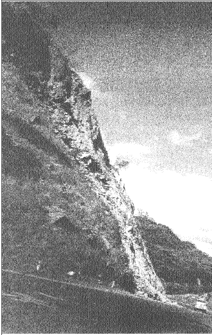
AYUDA HUMANITARIA Y CUERPO SUIZO DE SOCORRO EN CASO DE CATÁSTROFE - AH + CSS AGENCIA SUIZA PARA EL DESARROLLO Y LA COOPERACIÓN-COSUDE INSTITUTO NICARAGÜENSE DE ESTUDIOS TERRITORIALES (INETER) Derrumbe bajada de Cucamonga FIG. 8 Elaboración: Raúl Carreño C Nicaragua 1998