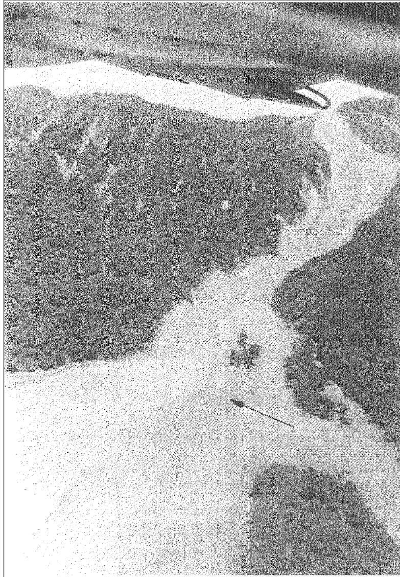
Fig. 2 - Zona de arranque con restos del derrumbe inicial

La flecha marca la platea donde pudo originarse el efecto disipador que liberaría parte del agua originando la tromba