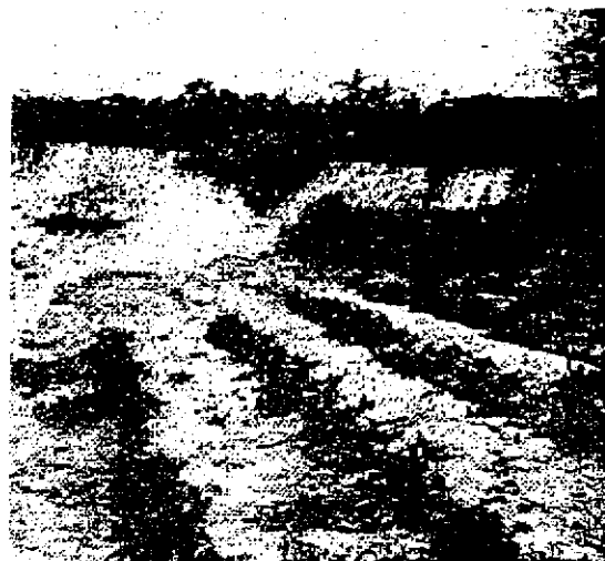
FOTO N° 4.1.3.4 DESLIZAMIENTO Y CORTE DE TERRENO DE FAMILIA ORTIZ