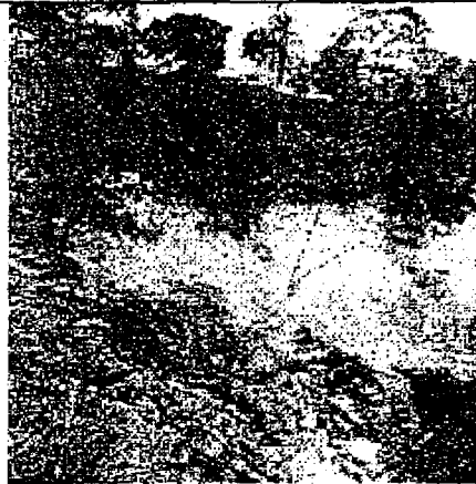
FOTO N°4.1.3.2 TERRENO DERRUMBADO EN PROXIMIDADES DE ALBERGE CENTRO