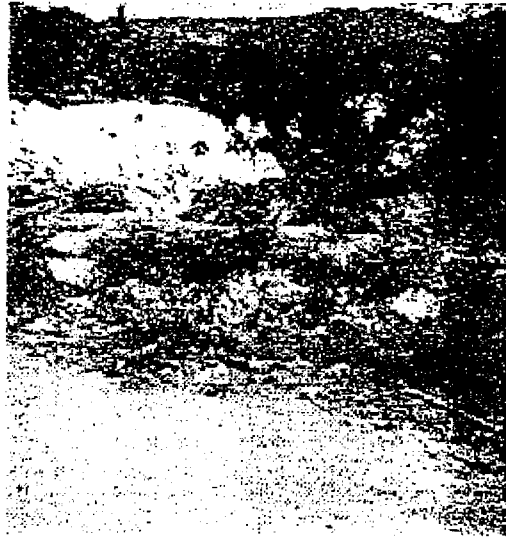
FOTO N°4.1.3.1 CALLE PRINCIPAL DE MIRAFLORES ABAJO CON PELIGRO DE COLAPSO