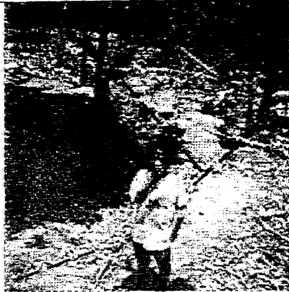
Fig. 4.1.1.5 FRACTURAS EN LA JOYA