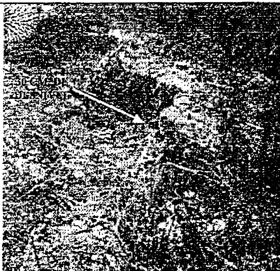
FOTO Nº 1.1.4 FRACTURA EN TERRENO CASERIO LA JOYA, ADYACENTE A QUEBRADA BARRANCON