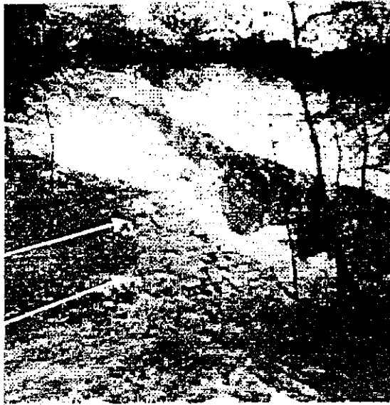
FOTO Nº 1.1.1 QUEBRADA BARRANCON, CASERIO LA JOYA.