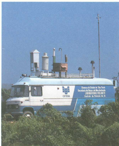
Monitoramento da qualidade do ar no alto da serra

“Um compromisso com a sobrevivência” - assim é definido o Programa de Controle da Poluição Industrial de Cubatão, desenvolvido de forma concentrada e simultânea sobre 320 fontes de poluição dos 23 complexos industriais daquele município.