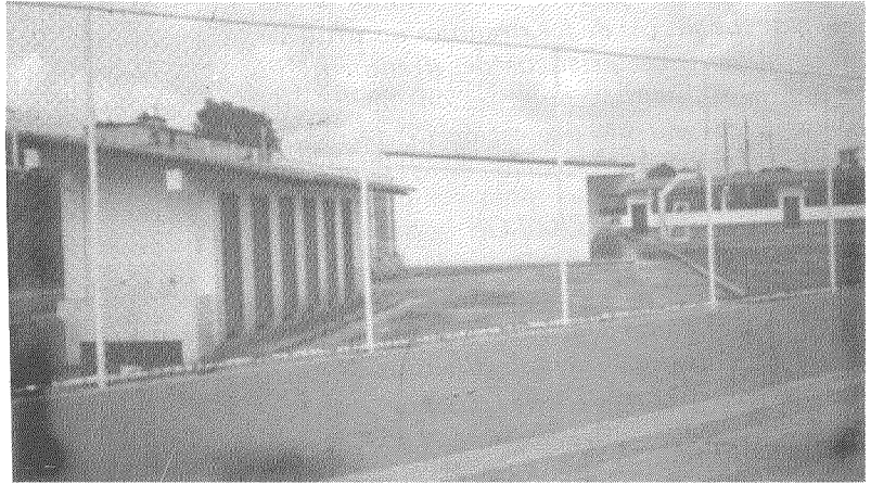
Escuela Julio Betancourt, Santa Rosa - El Oro. La mayor elevación de las baterías sanitarias redujo el riesgo de contaminación de las aguas durante la inundación

Se requiere, además de un buen mantenimiento, que los pozos se diseñen con una mayor capacidad de carga, (especialmente cuando los terrenos son poco permeables) y disponer de un gran desnivel entre los puntos de carga (baterías sanitarias) y los sitios de descarga o áreas de infiltración. Esto último es posible si las baterías sanitarias se construyen sobre un nivel alto.