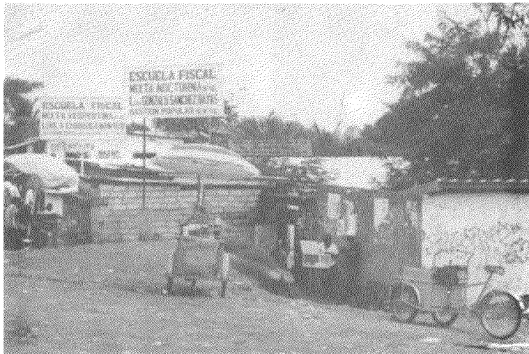
Escuela Luisa Marín González, Bastión Popular - Guayaquil. Es un ejemplo de una escuela construida sobre un nivel muy bajo.

Finalmente, se recomienda proyectar el piso más bajo de la escuelas (patios y corredores) como mínimo 35 centímetros por encima del nivel de la acera existente, o 50 cuando se utilice el nivel de la calle o carretera pavimentada como un referente.