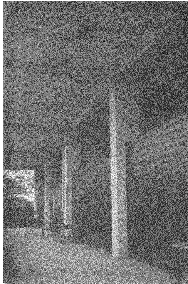
Colegio Calderón, Milagro - Guayas. La ausencia de un mantenimiento preventivo incrementa los daños. Es necesario realizar trabajos de impermeabilización de las cubiertas de hormigón para impedir el deterioro de la losa, instalaciones, etc.

En todos los colegios siempre es necesario disponer de un presupuesto de mantenimiento para aplicar pintura anticorrosiva a las estructuras metálicas y reparar los daños en las cubiertas antes del inicio de la estación lluviosa.