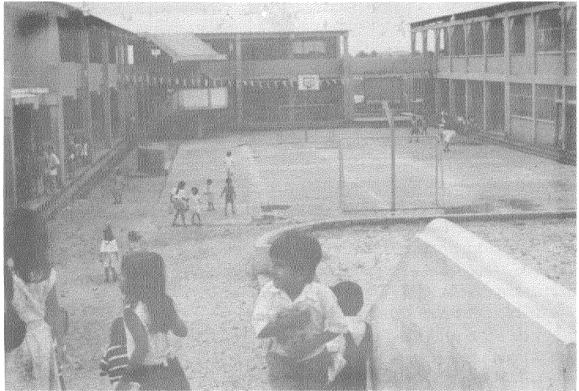
La escuela Luis Noboa Icaza, Bastión Popular-Guayaquil; esta siendo ocupada como albergue por cerca de 300 personas

Dado que en una zona de desastre el porcentaje de las personas y edificaciones afectadas es alto, y que los damnificados requieren de urgente atención y movilización a un sitio próximo a la emergencia, se debe estar preparado para admitir que cualquier escuela puede servir como albergue, si se dispone de la logística (personal de F.F.A.A., Cruz Roja y Defensa Civil) suministros (ropa, alimentos, medicinas, etc.) menaje y equipos móviles (baterías sanitarias, cocinas, etc.) para su rápida instalación y movilización a diversos sitios durante períodos cortos de tiempo.