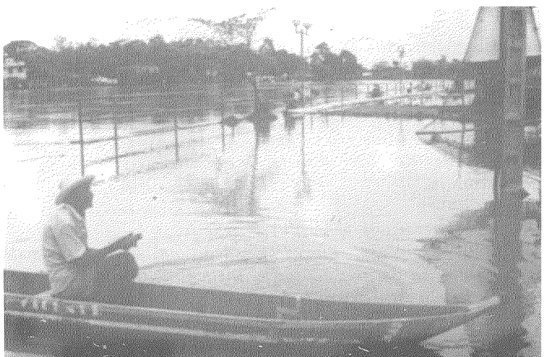
Malecón construido en Urbina Jado - Provincia del Guayas. Obsérvese como el río Vices ha reclamado el territorio que le pertenece