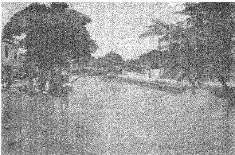
Malecón en construcción en General Vernaza - Provincia del Guayas.