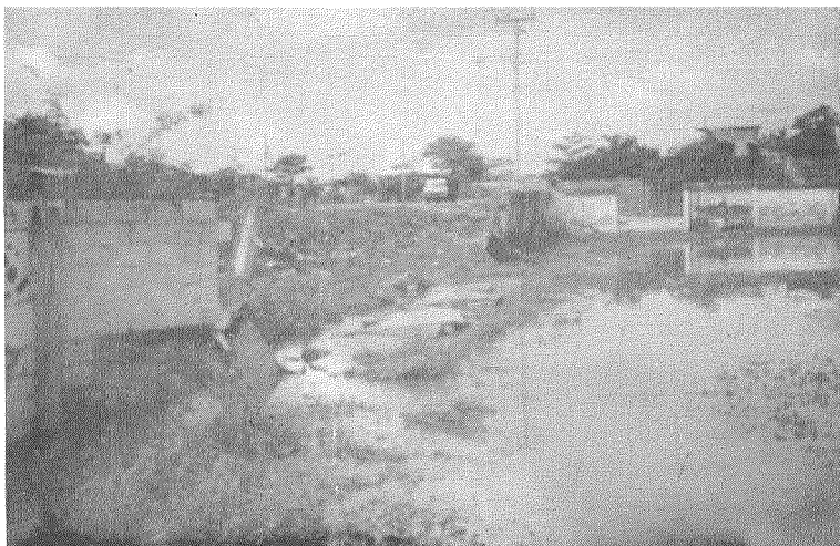
La construcción de una variante de circulación perimetral en la vía Santa Rosa - Huaquillas (Provincia de El Oro) con una rasante de 1.5 metros por encima de la elevación del Colegio Santa Rosa contribuyó a que se produjeran daños. Nótese que el paso de las aguas rompió el cerramiento del colegio.

Más adelante, los trabajos de reparación y protección contra inundaciones, usualmente conducen a la construcción de costosos diques a lo largo del río, con lo que se pierde buena parte de la belleza arquitectónica que inspiró la obra y se paga un alto precio por no haber considerado desde la etapa de planificación y diseño, los criterios de prevención y la información histórica sobre los peligros naturales