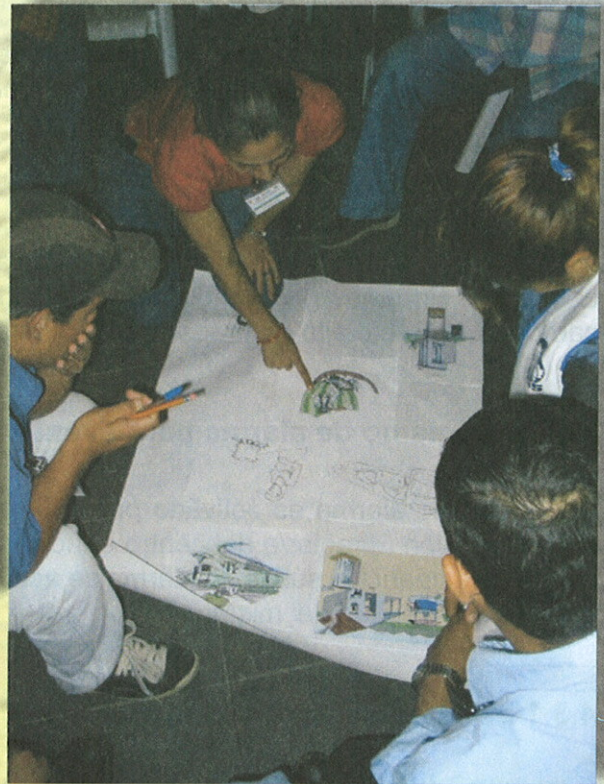
Capacitación de docentes en saneamiento

El Coordinador/a General de la Comisión de Protección Escolar, activa los comités, y éstos a su vez, informan a la comunidad educativa.