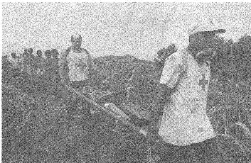
Socorristas de Cruz Roja rescatan a niña afectada por el terremoto de la Laguna de Apoyo.