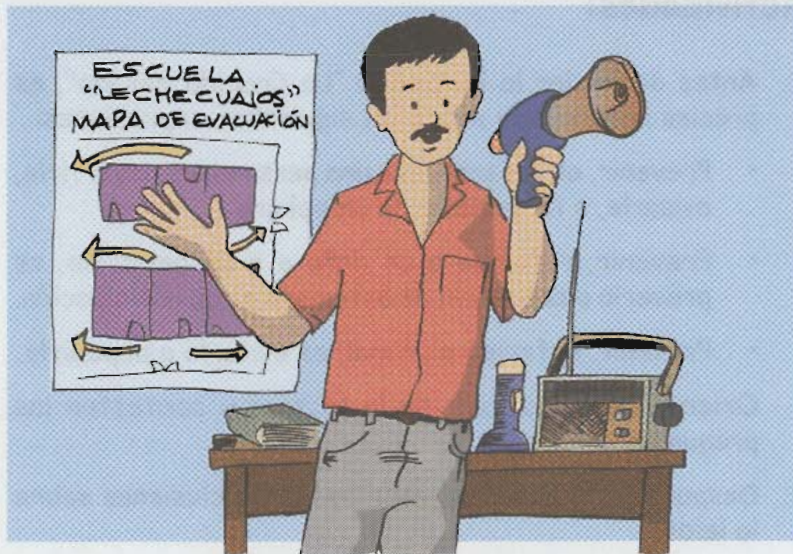
Lámina 3: Campaña de información