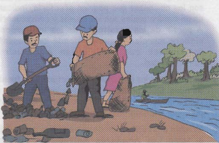
Lámina 1: Evitemos contaminar las fuentes de agua.