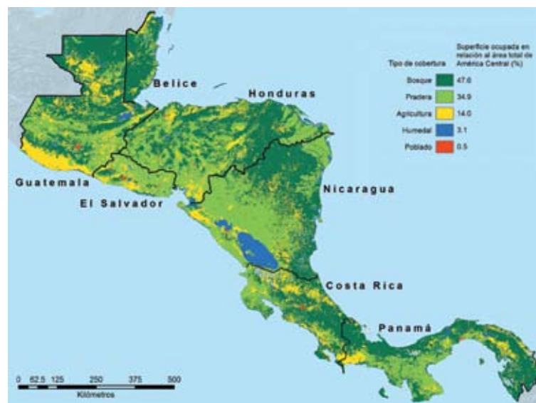
MAPA 2 CAMBIO DE COBERTURA DEL SUELO EN CENTROAMÉRICA (2005)