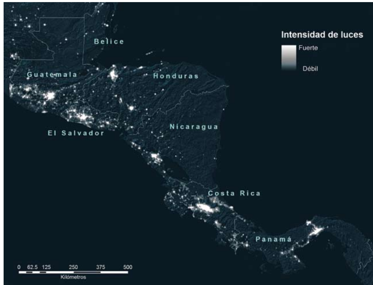
MAPA 3 IMAGEN NOCTURNA DE CENTROAMÉRICA (1998)

» En términos porcentuales, Panamá es el país de Centroamérica con mayor proporción de población urbana (72.4), seguido por Costa Rica (62.8), El Salvador (60.4), Nicaragua (59.8), Belice (48.7), Honduras (47.4) y Guatemala (48.1) (PAHO, 2007).