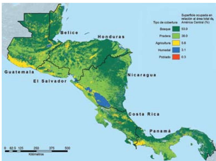
MAPA 1 CAMBIO DE COBERTURA DEL SUELO EN CENTROAMÉRICA (2000)